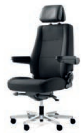
Heavy Stark tissu